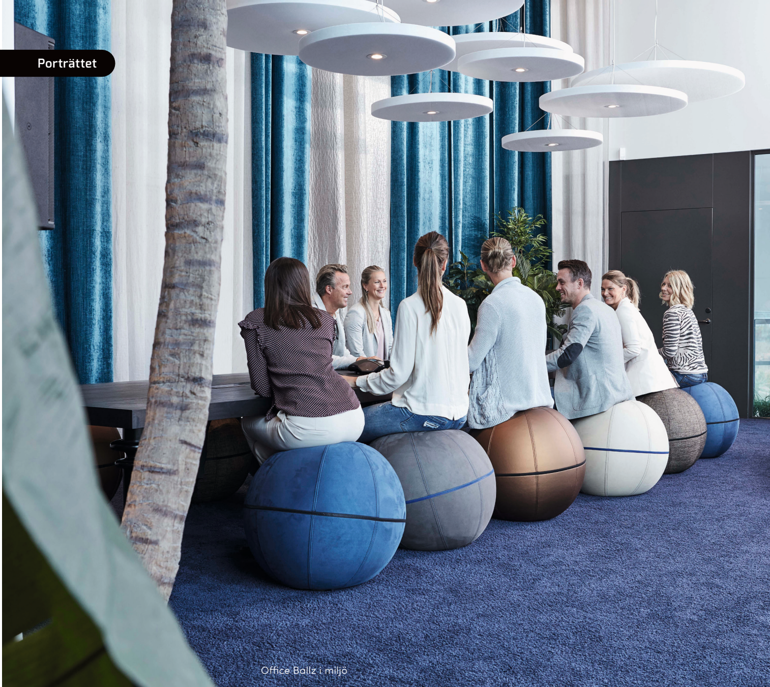
Office Ballz i miljö

OFFICE BALLZ är en ergonomisk sittmöbel med inbyggd pilatesboll som gör att du måste balansera för att sitta upprätt och på så sätt tränar och stärker du delar av rygg, bål och ben samt får en bättre hållning. Bollen går att få i två storlekar med textil och dragkedja i stor variation. Bollens pilatesboll regleras med medföljande pump, har en förstärkt botten och en metallplatta för stabilitet.