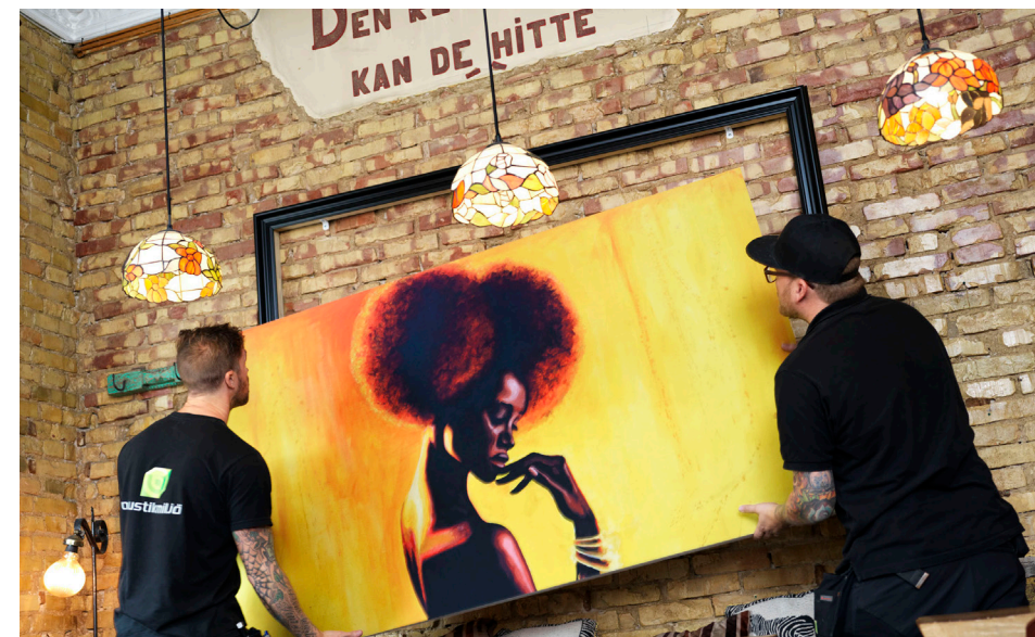
Absorbenter med print förbättrar ljudmiljön, och skapar snygg inredningsdesign

OFFICE NAP är en sittmöbel för den korta tuppluren, perfekt för att snabbt hämta energi till nästa möte. Ett bra inslag i det aktivitetsbaserade tänket. En kort vilopaus på arbetstid kan öka prestationen och arbetsglädjen.