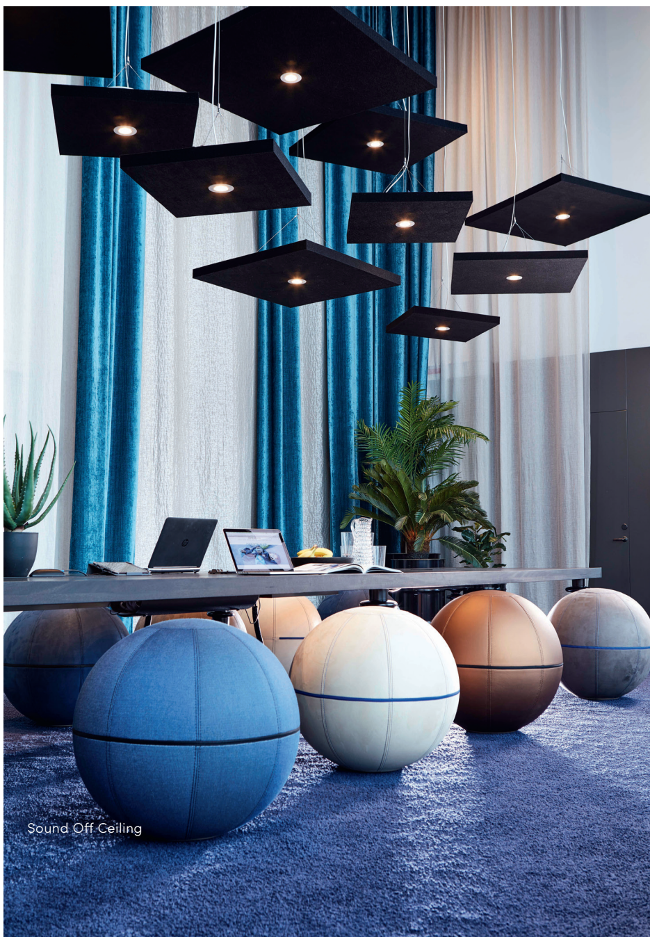
Sound Off Ceiling